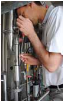
Abschöpfen von Steirischem Rosenöl