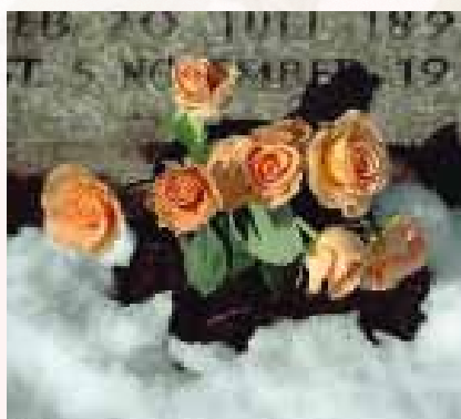
Rosen am Grab

Es wird vielleicht auch noch die Todesstunde Uns neuen Räumen jung entgegen senden, Des Lebens Ruf an uns wird niemals enden ... Wohlan denn, Herz, nimm Abschied und gesunde!“ (Hermann Hesse) 7