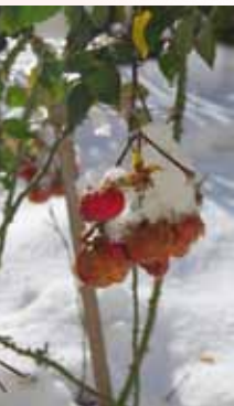
Rose im Schnee