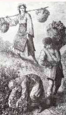
Rosenernte bei Kazanlak in Bulgarien um 1870