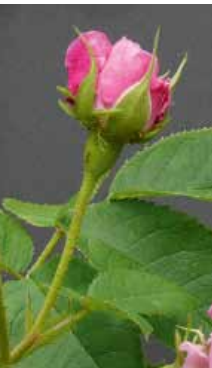
Rosenknospe Ville de Bruxelles

Damaszener-Rosen blühen meist in Rosa oder Weiß, selten in Rosarot. In der Symbolik der Farben verkörpert „Weiß“ die Farbe des Lichtes, der Erleuchtung, Verklärung, Auferstehung und der Vollkommenheit. Sie ist ein Attribut der Reinheit und Jungfräulichkeit Mariens, der Gottesmutter. „Rosa“ dagegen symbolisiert die Farbe der Zärtlichkeit, der Empfindsamkeit, Sanftheit und Bescheidenheit. Sie stellt die Farbe des jungen Lebens dar.